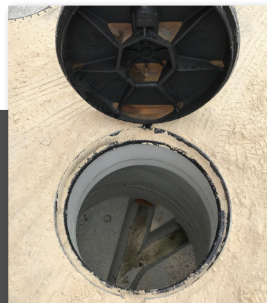
Gamme perfect L regard DN 1000