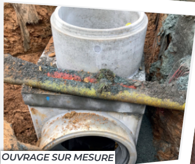
OUVRAGE SUR MESURE