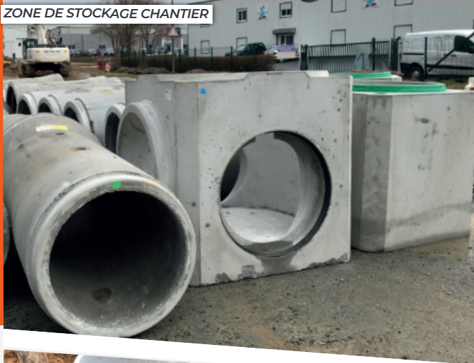
ZONE DE STOCKAGE CHANTIER

LIBAUD : UNE SOLUTION COMPLÈTE, HOMOGENÈE ET ÉTANCHE, D'OUVRAGES EN BÉTON POUR UN PROJET D'ENVERGURE DE GESTION DES EAUX PLUVIALES