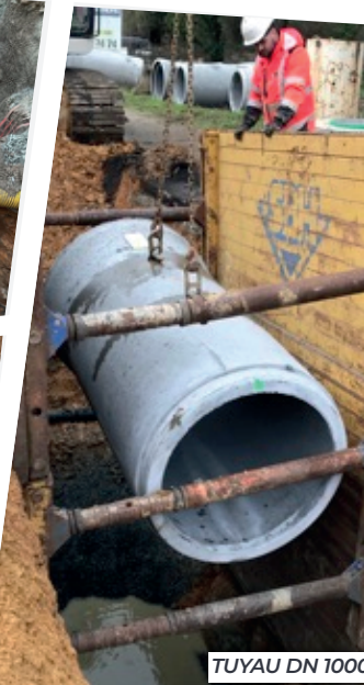
TUYAU DN 1000